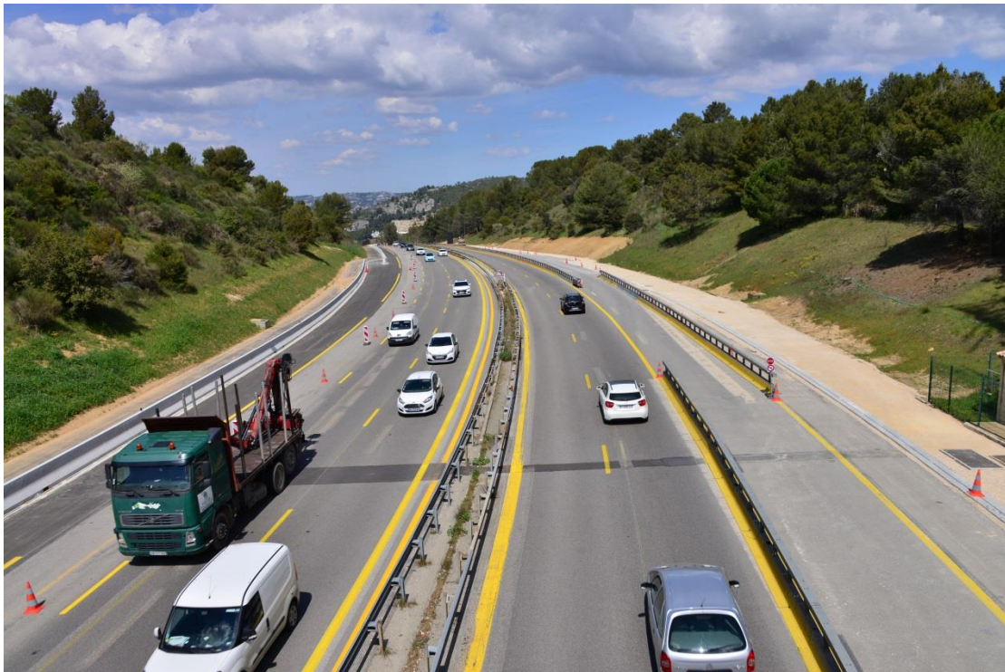
La zone de chantier se met en place au fur et à mesure entre les deux sens de circulation de l'autoroute A52.

Dans le cadre de l'élargissement de l'autoroute A52 entre Roquevaire et La Bouilladisse, VINCI Autoroutes a engagé la rénovation de tous les dispositifs de sécurité et d'assainissement situés dans le terre-plein central. La mise en place de la zone de chantier entre les deux sens de circulation se poursuivra durant la nuit du lundi 6 au mardi 7 mai. Pour limiter la gêne à la circulation, ces interventions nécessiteront des modifications de la circulation. Des itinéraires de déviation seront mis en place pour les conducteurs afin qu'ils puissent rejoindre leur destination.