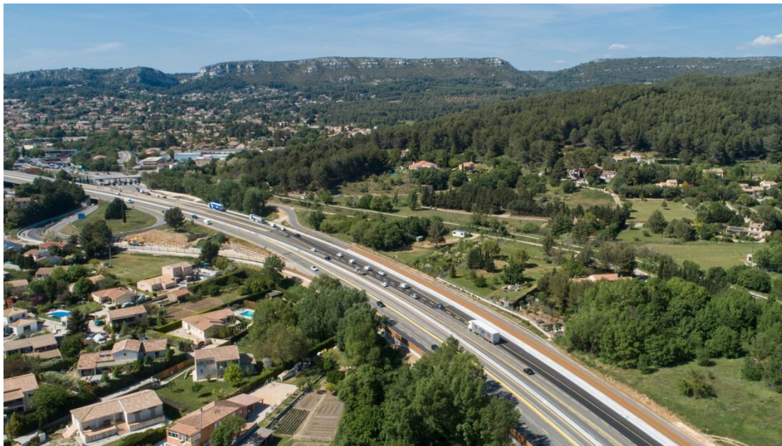
L'élargissement se poursuit dans le secteur des communes de La Bouilladisse et de La Destrousse

VINCI Autoroutes poursuit les travaux de rénovation des joints de dilatation du pont de l'échangeur de la Destrousse (n°33). Pour limiter la gêne à la circulation et réaliser cette deuxième phase en toute sécurité, ces travaux se dérouleront pendant 4 nuits entre le 3 et le 7 juin 2019. Ils nécessiteront à chaque fois une coupure de la circulation sur l'A52, dans ce secteur, en direction d'Aix-en-Provence. Un itinéraire de déviation sera mis en place pour les conducteurs afin qu'ils puissent rejoindre leur destination.