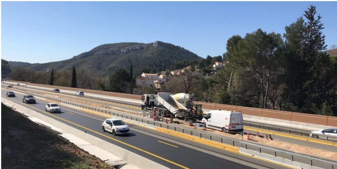
Les travaux d'assainissement sont en cours entre les deux sens de circulation de l'A52

Dans le cadre de l'élargissement de l'autoroute A52 entre Roquevaire et La Bouilladisse, VINCI Autoroutes a engagé la rénovation de tous les dispositifs de sécurité et d'assainissement situés dans le terre-plein central. La mise en place de la zone de chantier entre les deux sens de circulation se poursuivra durant les nuits des mercredi 24 et jeudi 25 avril prochains. Pour limiter la gêne à la circulation, ces interventions nécessiteront des modifications de la circulation. Des itinéraires de déviation seront mis en place pour les conducteurs afin qu'ils puissent rejoindre leur destination.