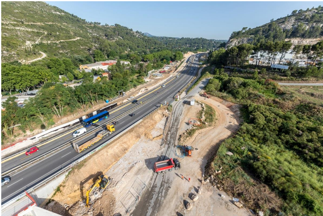
Le chantier d'élargissement de l'A52 à 2x3 voies est en pleine activité

VINCI Autoroutes poursuit la mise en place de la zone de chantier dans le terre-plein central de l'autoroute A52 entre La Bouilladisse et Roquevaire. Ainsi, les travaux de rénovation de l'ensemble des dispositifs de sécurité et d'assainissement situés entre les deux sens de circulation continueront. Afin de limiter la gêne à la circulation et pour réaliser ces opérations en toute sécurité, ces interventions nécessiteront des fermetures de l'A52 durant 4 nuits la semaine du 25 au 29 mars 2019. Des itinéraires de déviation seront mis en place pour les conducteurs afin qu'ils puissent rejoindre leur destination.