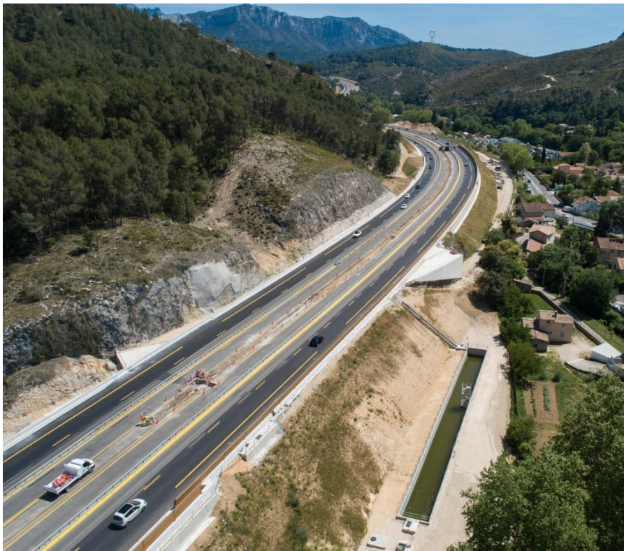
L'élargissement de l'A52 bat son plein entre l'échangeur de La Destrousse (n°33) et la barrière de péage de Pont de l'Etoile

Dans le cadre de l'élargissement de l'autoroute A52 à 2x3 voies entre La Bouilladisse et Roquevaire, VINCI Autoroutes poursuit les travaux de rénovation de joints sur l'ouvrage situé au niveau de l'échangeur de la Destrousse (n°33) et réalise une nouvelle chaussée sur l'A520 en direction d'Auriol. Pour limiter la gêne à la circulation et réaliser ces opérations en toute sécurité, ces travaux se dérouleront durant deux nuits des 27 et 28 mai. Ils nécessiteront à chaque fois des modifications de la circulation et la mise en place d'itinéraires de déviation pour les conducteurs afin qu'ils puissent rejoindre leur destination.