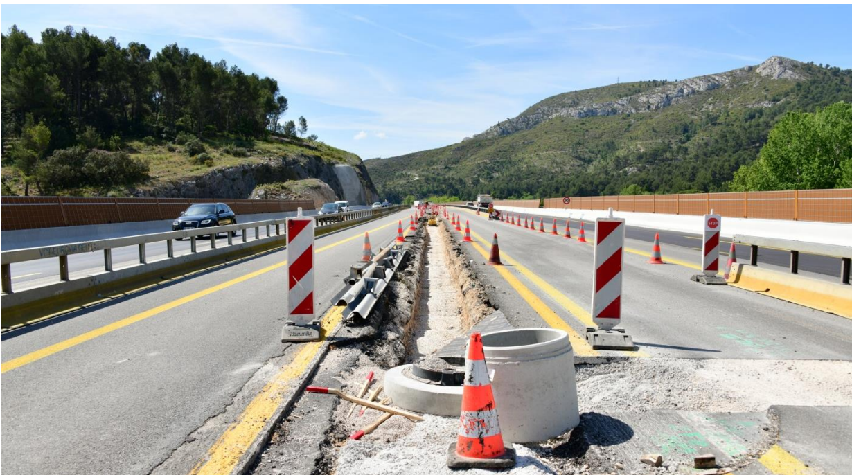
Les travaux se poursuivent dans le terre-plein central, entre les deux sens de circulation, sur les 8 km du chantier.

VINCI Autoroutes poursuit l'élargissement de l'A52 entre Roquevaire et la Bouilladisse. L'avancement du chantier nécessite de modifier la zone de chantier dans le secteur de l'échangeur de la Destrousse (n°33) et de la bretelle de l'A520. Afin de limiter la gêne à la circulation et pour réaliser ces opérations en toute sécurité, ces interventions nécessiteront des fermetures de l'A52 et de l'A520 les nuits du lundi 1 au jeudi 4 juillet inclus. Des itinéraires de déviation seront mis en place pour les conducteurs afin qu'ils puissent rejoindre leur destination.