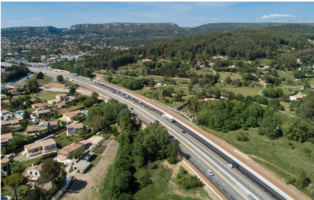
Les travaux se poursuivent dans le terre-plein central, entre les deux sens de circulation, sur les 8 km du chantier.

VINCI Autoroutes poursuit l'élargissement de l'A52 entre Roquevaire et la Bouilladisse. L'avancement du chantier nécessite de modifier la zone de chantier dans le secteur de l'échangeur de la Destrousse (n°33). Afin de limiter la gêne à la circulation et pour réaliser ces opérations en toute sécurité, ces interventions nécessiteront la fermeture de la bretelle d'entrée de l'échangeur de La Destrousse (n°33), en direction d'Aix-en-Provence, les nuits des 8 au 10 juillet inclus. Des itinéraires de déviation seront mis en place pour les conducteurs afin qu'ils puissent rejoindre leur destination.