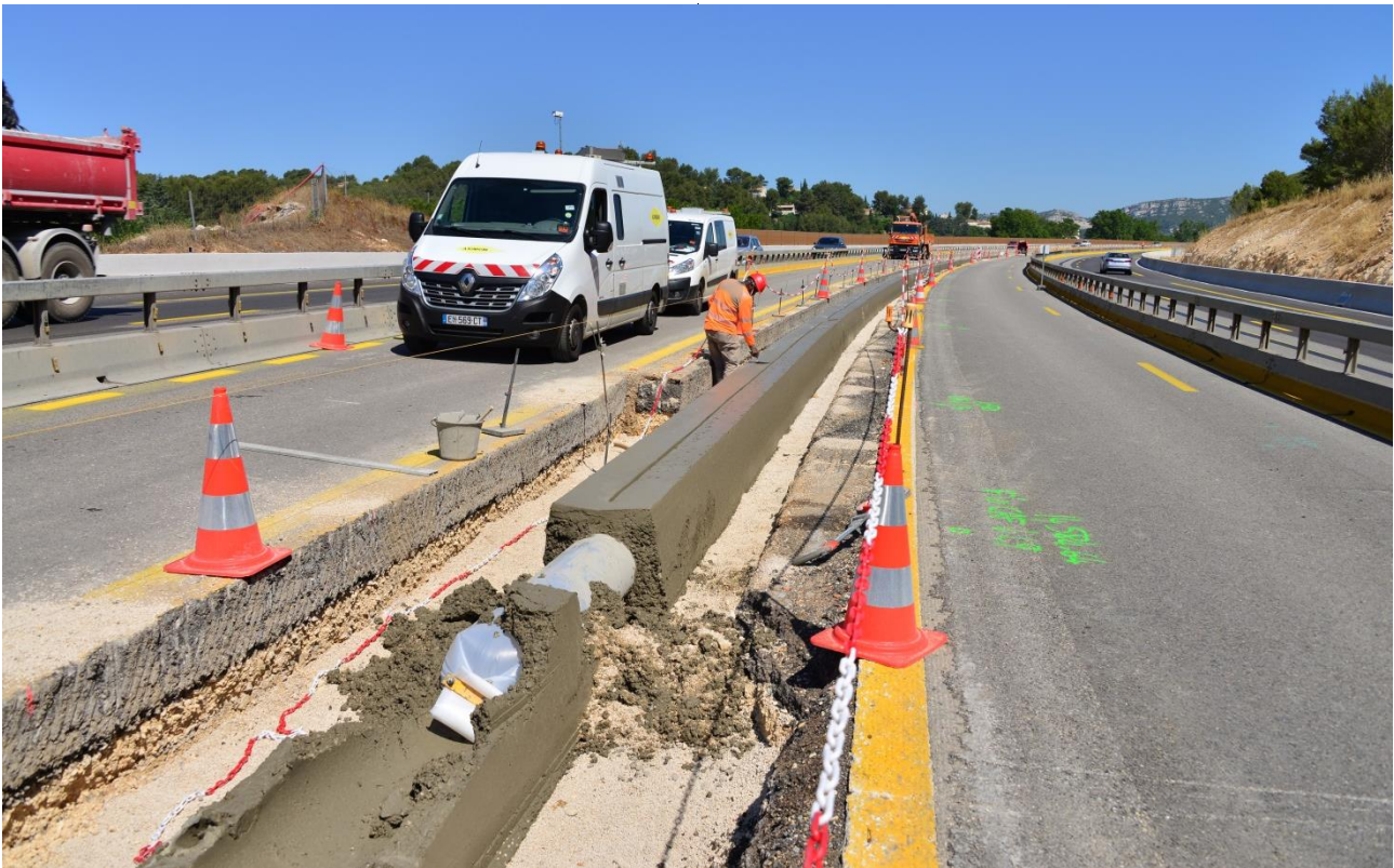
Mise en place des fondations de la glissière en béton armé qui viendra séparer, à terme, les deux sens de circulation

VINCI Autoroutes poursuit la création d'une nouvelle voie entre La Bouilladisse et Roquevaire sur l'autoroute A52. Pour limiter la gêne à la circulation et réaliser les nombreux ateliers, ces opérations se dérouleront pendant 4 nuits, du 19 août au soir au 23 août au matin. Elles nécessiteront des modifications de la circulation, entre la bretelle de l'A520 et l'échangeur de La Destrousse (n°33), en direction d'Aix-en-Provence. Des itinéraires de déviation seront mis en place pour les conducteurs afin qu'ils puissent rejoindre leur destination.