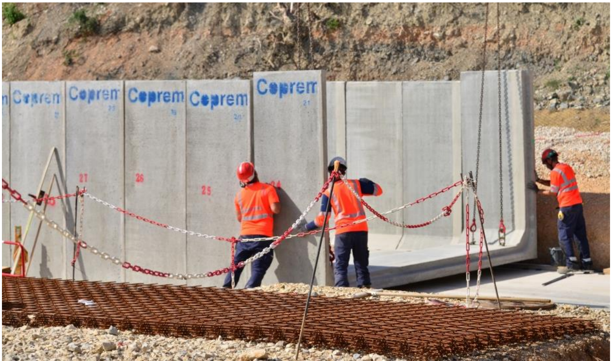
Mise en place des cadres en béton d'un futur bassin de protection de la ressource en eau.

VINCI Autoroutes continue les travaux d'élargissement de l'autoroute A52. Afin de limiter la gêne au trafic, des opérations nocturnes sont programmées dans le secteur de l'échangeur de La Destrousse (n°33) entre les 27 et 30 août. Elles nécessiteront des modifications de la circulation. Des itinéraires de déviation seront mis en place pour les conducteurs afin qu'ils puissent rejoindre leur destination.