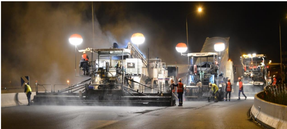
Chantier de chaussée sur l'autoroute A8, de nuit, dans les Alpes-Maritimes.

Dans le cadre de son programme d'entretien des chaussées, VINCI Autoroutes va procéder à la rénovation des chaussées de l'autoroute A52, dans les deux sens de circulation, sur deux secteurs : celui de Fuveau dans un premier temps puis celui de La Bouilladisse / Pont de l'Etoile en suivant. Les travaux débiteront le 16 septembre pour un mois, sur le secteur de Fuveau. Ensuite, la même opération se déroulera entre la mi-octobre et la fin décembre 2019 sur la zone en cours d'élargissement entre La Bouilladisse et Pont-de-l'Etoile. Pour réaliser ces travaux en toute sécurité et minimiser la gêne à la circulation, ces opérations seront uniquement réalisées de nuit avec des modifications de la circulation.