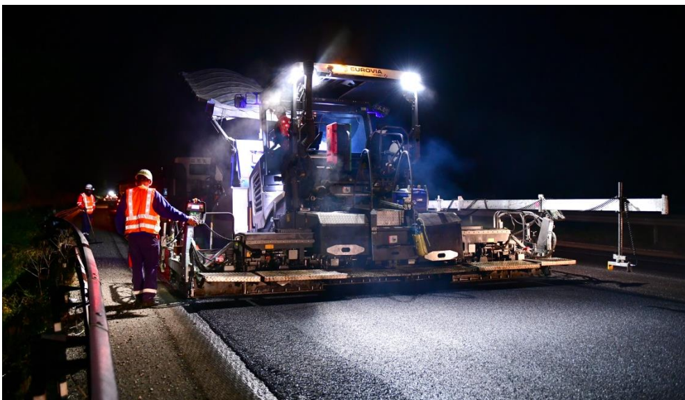
Rabotage de la chaussée et application du nouvel enrobé à l'aide d'un finisher