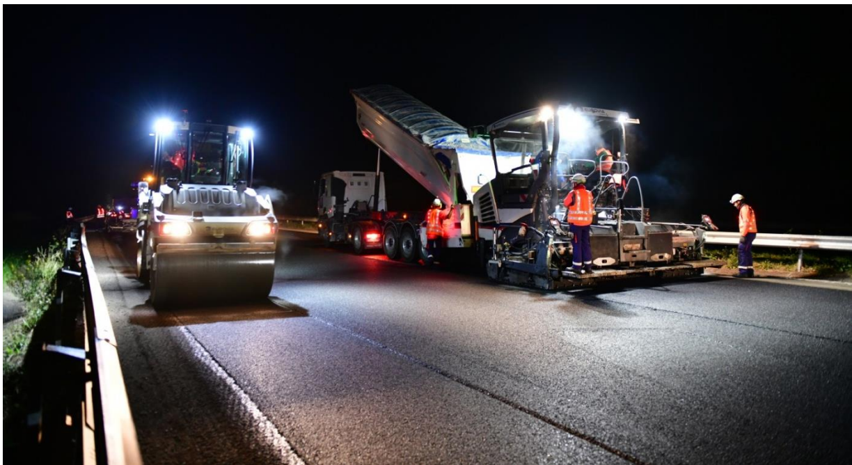
Atelier d'application d'enrobé sur l'A52

La rénovation des chaussées engagée dans le secteur de Fuveau et l'élargissement, plus au sud, entre La Bouilladisse et Roquevaire, sur l'A52, se poursuivent. La semaine prochaine, ces opérations nécessiteront des modifications de circulation entre la bifurcation A8/A52 et l'échangeur de La Destrousse, et sur la bretelle A520 en direction d'Auriol. Afin de garantir la sécurité des équipes et des usagers et pour limiter la gêne au trafic, ces interventions seront réalisées de nuit, entre 22h et 5h, hors week-end.