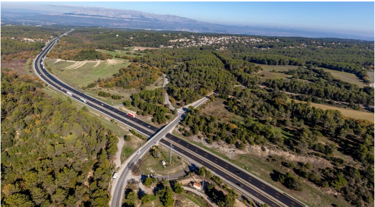
Site du futur échangeur de Belcodène

Au cœur du pays d'Aubagne et de l'Etoile, l'autoroute A52 relie les principaux pôles d'activités des Bouches-du-Rhône. La création de l'échangeur de Belcodène répond à un besoin de mobilité grandissant au sein d'un territoire dynamique, en plein développement. Ce nouvel accès permettra une meilleure connexion entre les routes départementales de ce secteur et l'A52 et facilitera les liaisons avec Aix-en-Provence et Marseille. La première étape de ce projet débute avec la construction du pont qui enjambera l'autoroute A52 pour donner accès à cet échangeur.