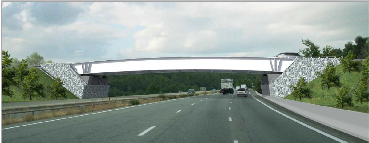
Représentation indicative du pont de l'échangeur de Belcodène enjambant l'autoroute A52.

La pose du tablier est à la fois une opération technique et spectaculaire. Le tablier du pont de 450 tonnes sera transporté par une remorque motorisée, utilisée spécifiquement pour ces opérations, qui empruntera l'autoroute A52 alors fermée à la circulation. Lors de son déplacement, le tablier circulera en position haute. Une fois arrivé sur site, il passera au-dessus des appuis situés de part et d'autre de l'autoroute, avant d'être posé dessus. Ensuite, des techniciens et des ingénieurs spécialisés procéderont à la mise en place de la structure et au contrôle du positionnement du tablier sur ses appuis définitifs avant la remise en circulation de l'autoroute à l'aube.