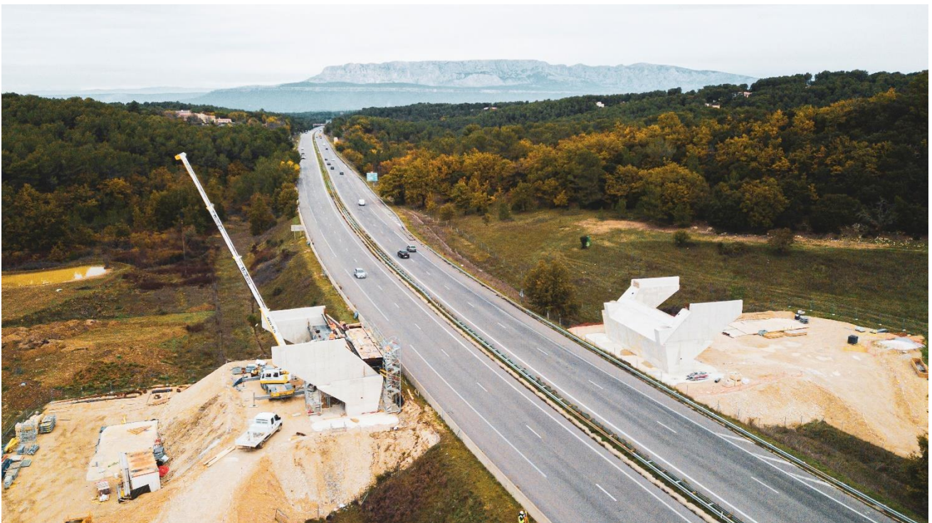
Le tablier du pont sera posé sur les deux appuis construits de part et d'autre de l'autoroute A52

Dans les Bouches-du-Rhône, VINCI Autoroutes poursuit la construction du pont de l'échangeur de Belcodène, entre la bifurcation des autoroutes A8/A52 et l'échangeur de Pas-de-Trets (n°33). Cette semaine, le chantier entrera dans une nouvelle phase avec la pose du tablier du pont sur ses appuis. Cette opération exceptionnelle sera réalisée au-dessus des voies de l'autoroute A52 et nécessitera pour des raisons de sécurité, une fermeture de l'autoroute dans les deux sens de circulation. Afin de limiter la gêne au trafic, cette intervention aura lieu la nuit du jeudi 19 au vendredi 20 décembre entre 21h et 5h. Des itinéraires de déviation balisés seront mis en œuvre sur le réseau secondaire pour permettre aux conducteurs de rejoindre leur destination.